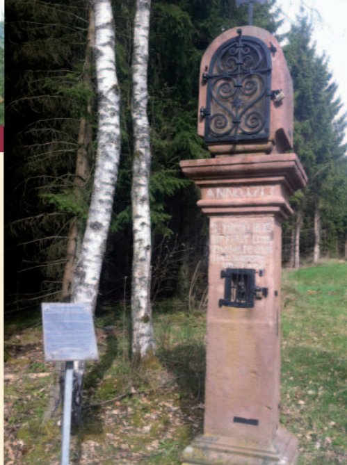
Bildstock am Steinernen Kreuz mit der Inschrift „St. Nikolaus helfe uns über Wasser und Land“.

Familie Kuhlmann Haus Hilmeke 57368 Lennestadt - Luftkurort Saalhausen Telefon: 0 27 23 - 9 14 10 Telefax: 0 27 23 - 8 00 16 info@haus-hilmeke.de www.haus-hilmeke.de