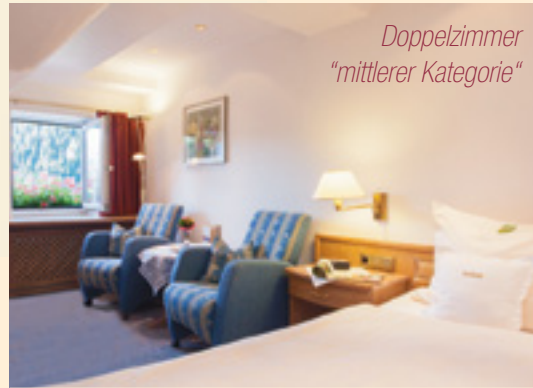
Doppelzimmer "mittlerer Kategorie"